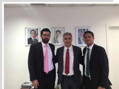
Parlamentares confirmaram apoio às demandas