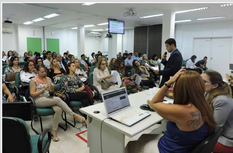
AGE realizada em 11/12 deliberou pela aprovação do PLC e reuniu 125 defensores públicos