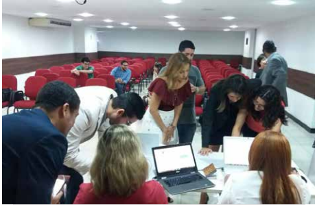
Voto eletrônico é colocado em prática

Mais uma etapa da reforma do estatuto da Adep-BA foi aprovada pelos associados no último trimestre. Com 147 votos válidos, os defensores públicos validaram a modificação dos artigos 19 e 26 do documento, alínea “h”, disciplinando o modo de chamado dos associados para assembleia geral e a forma de divulgação do boletim trimestral. A votação aconteceu no dia 6 de outubro.