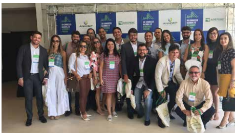
Parte da comitiva da Bahia em Florianópolis. Estado ficou atrás apenas do RJ e MG em presença no evento.

Quatro trabalhos foram aprovados e apresentados no concurso de teses e práticas exitosas pelos membros do Estado e dois deles conseguiram o segundo lugar. No torneio de futebol, o time da Adep-BA conquistou o vice-campeonato.