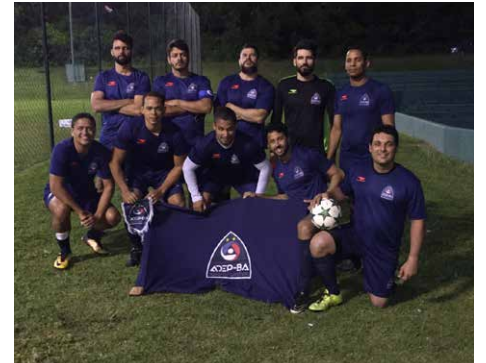
Time da Adep-BA foi vice-campeão do torneio de futebol.