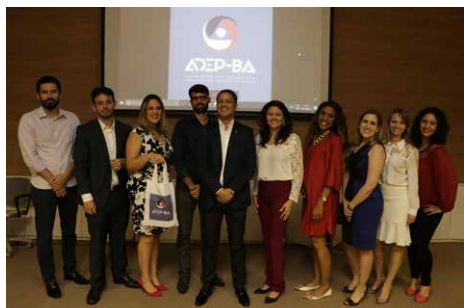
Lançamentos aconteceram no auditório da futura sede da Adep-BA

Apoio da Rede Bahia vai ampliar repercussão