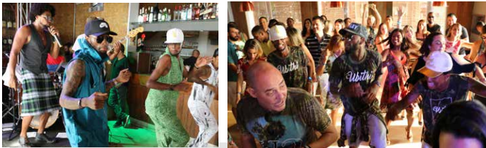
Solidariedade e integração na festa de confraternização da Adep-BA no Pereira, na Barra. Num clima bem "praieiro" e ao som de Magary Lord, os defensores públicos tiveram oportunidade de fazer doações para a ONG Abraço à Microcefalia